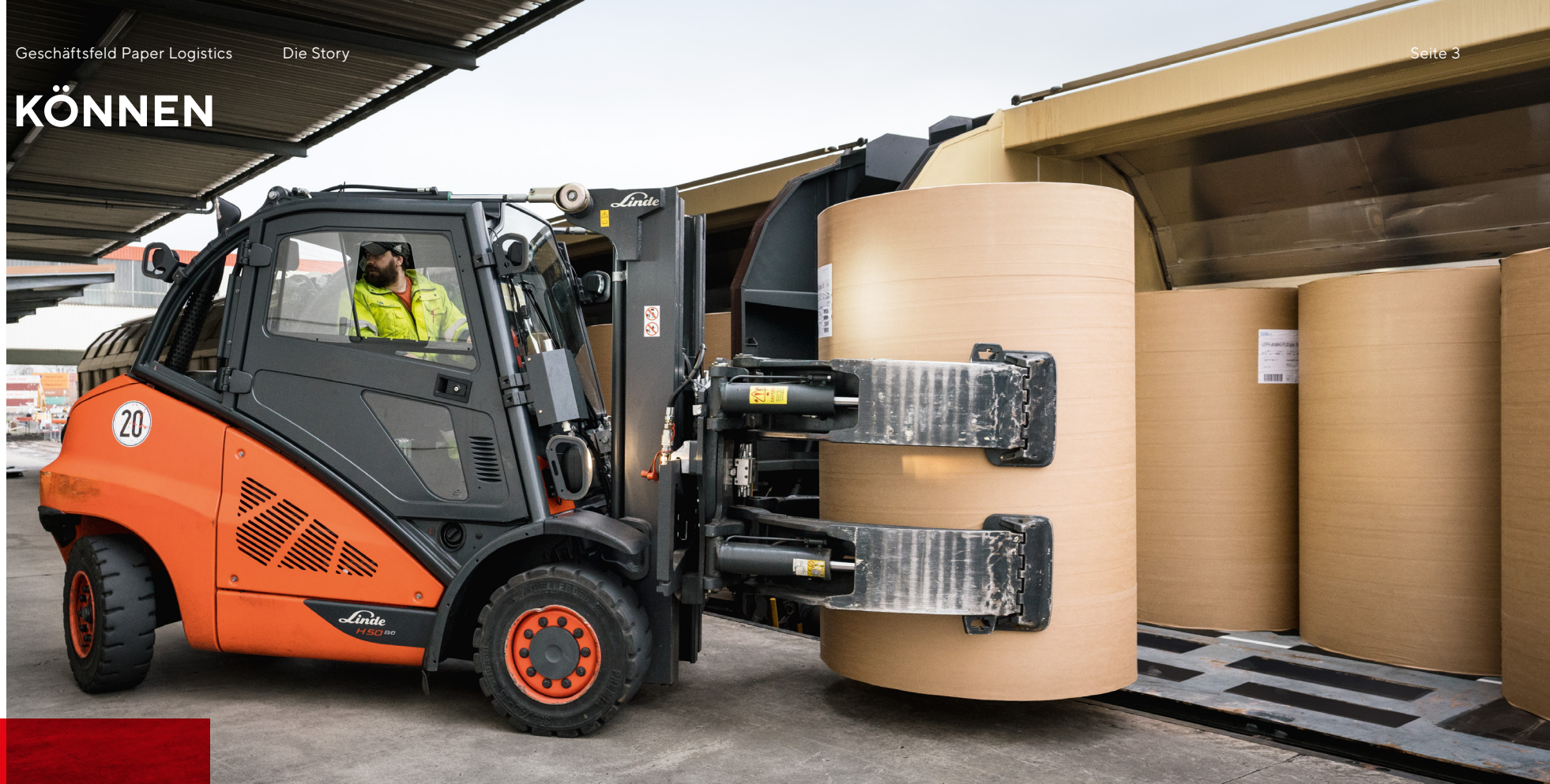
Mit dem richtigen Druck: ein Rollenklammer-Stapler in Aktion.