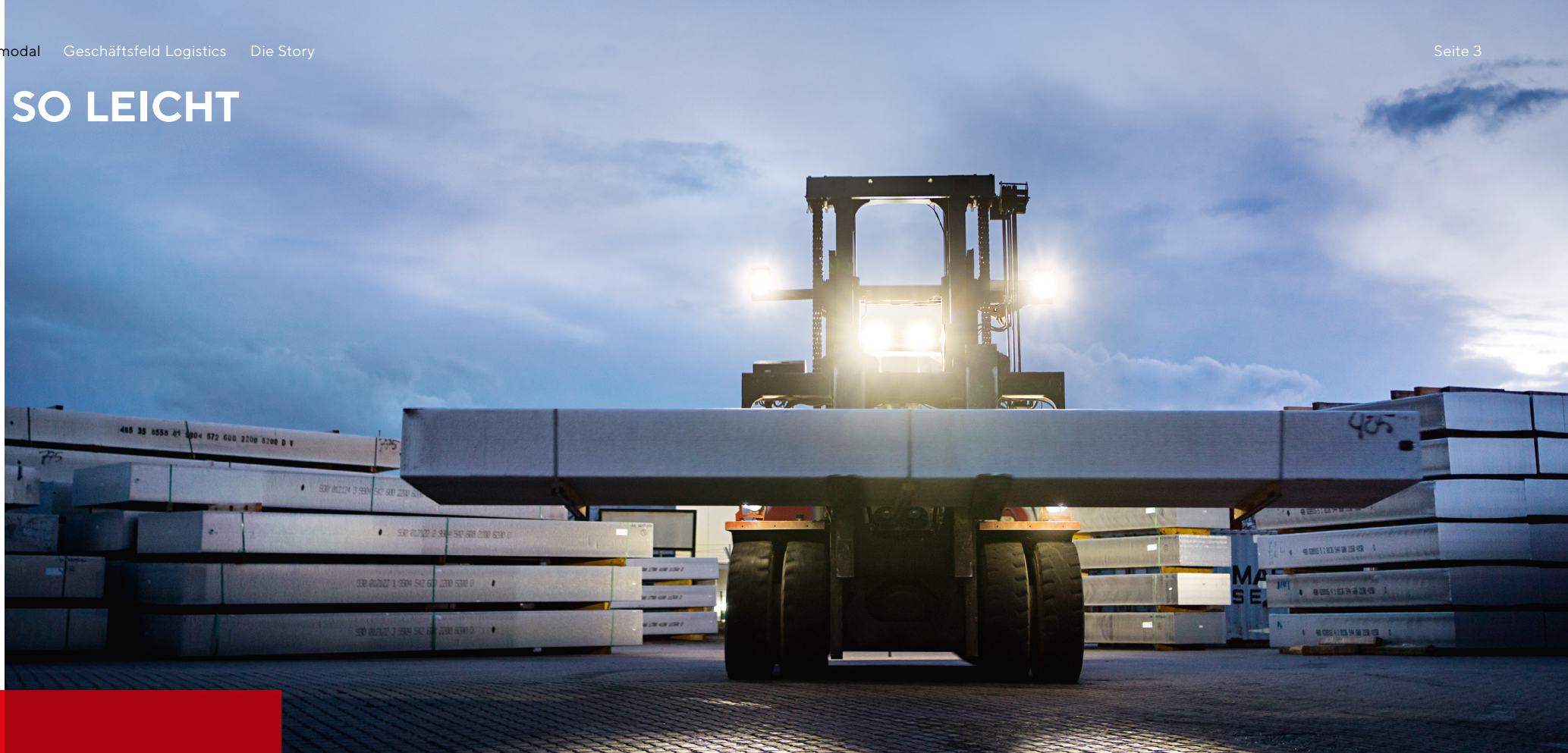
Spezialstapler mit einem tonnenschweren Aluminiumbarren.

Bis aus einem Aluminium-Walzbarren eine leichte Dose wird, braucht es in der Logistik schweres Gerät.